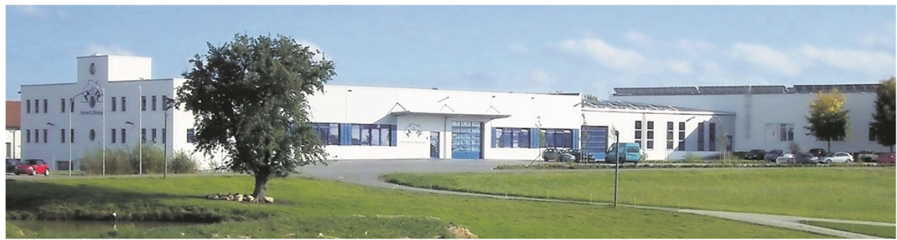
Die neue Produktionshalle der Firma Höcherl & Reisinger Zerspanungstechnik GmbH