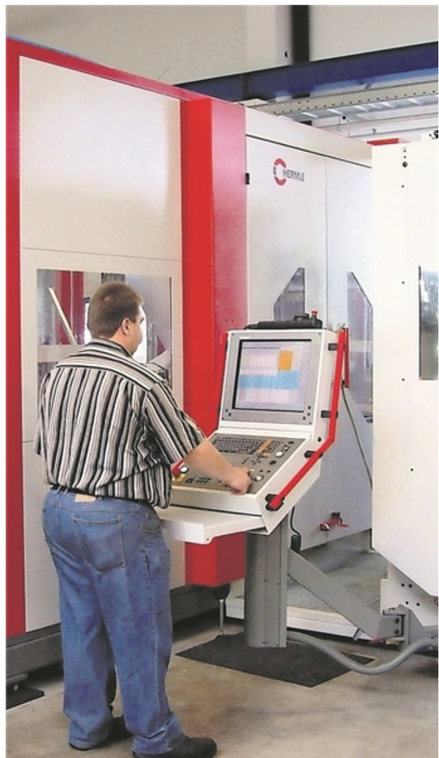
Die qualifizierten Mitarbeiter finden hochmoderne Maschinen vor.

Hier wird die Halle in einem gebührenden Rahmen unter Beisein von hochkarätigen Ehren Gästen eingeweiht.