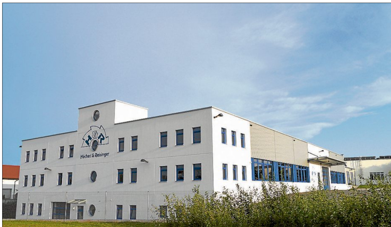
Personell konnte der Betrieb von ursprünglich zwei Mitarbeitern auf einen Mitarbeiterstamm von 80 Personen ausgebaut werden.