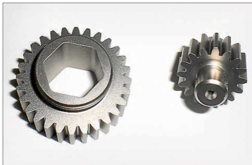
Hochpräzise Fertigung – Höchste Anforderungen werden bei der Produktion an die Fachkräfte gestellt.