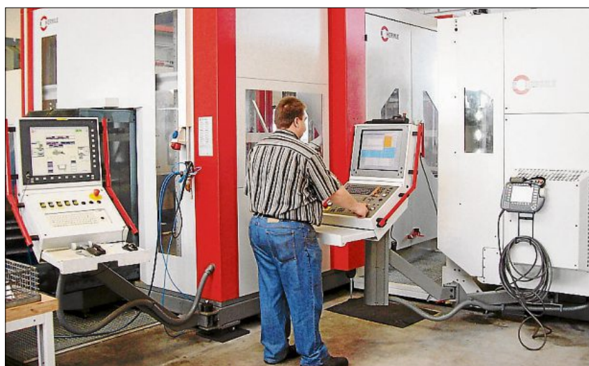
Das Unternehmen Höcherl&Reisinger in Walderbach ist mit modernsten Anlagen ausgestattet.