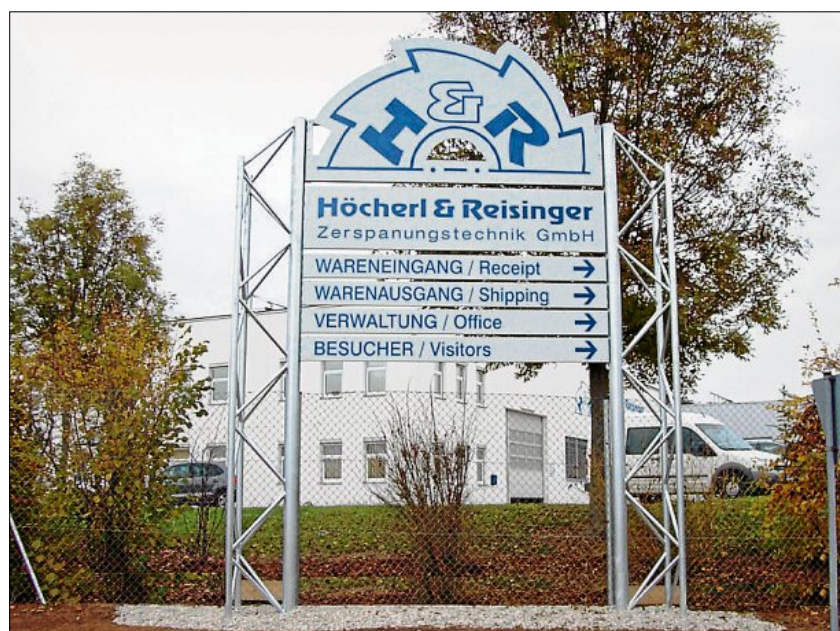
International aufgestellt – Höcherl&Reisinger exportiert seine Produkte unter anderem nach China, Brasilien und in die Vereinigten Staaten.